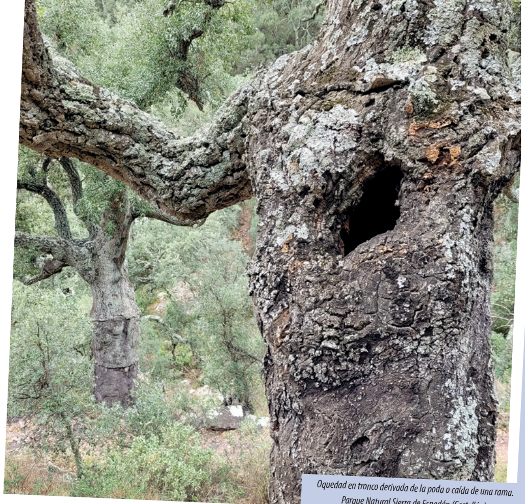
Oquedad en tronco derivada de la poda o caída de una rama. Parque Natural Sierra de Espadán (Castellón).

El árbol y la madera muerta, a través de la heterogeneidad de recursos que ofrece, crea vida y la vida conforma redes complejas de interacciones que se traducen en una serie de funciones ecológicas que mantienen