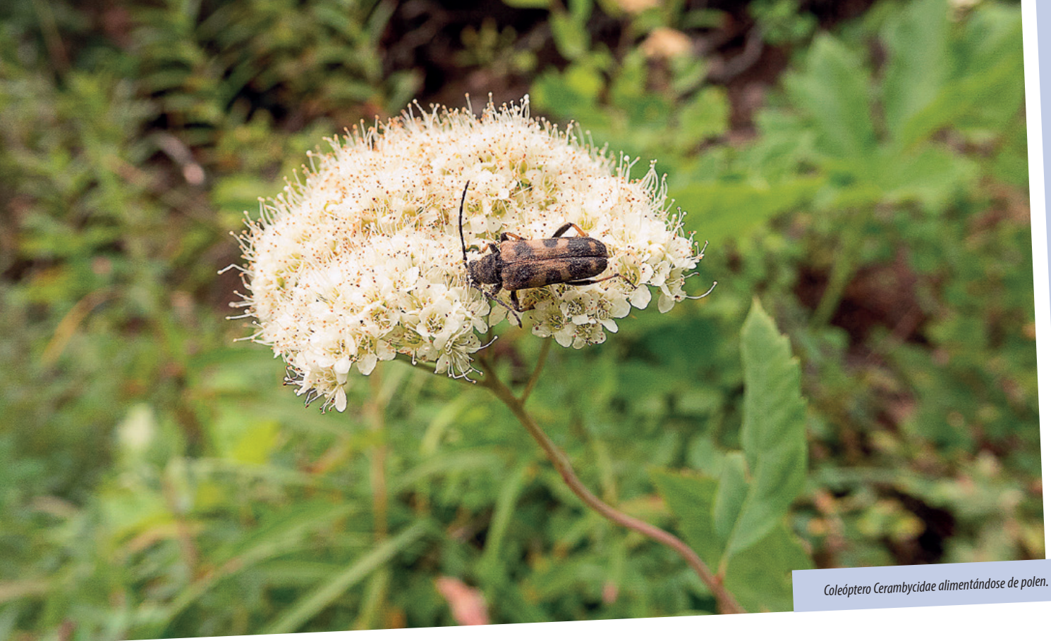
Coleóptero Cerambycidae alimentándose de polen.

70 y un 90 % de los coleópteros saproxílicos muestran diferencias en sus preferencias entre el linaje de las coníferas (gimnospermas) y el de las especies arbóreas de hoja ancha (angiospermas), siendo a su vez evidente la mayor diversidad de coleópteros saproxílicos en árboles de hoja ancha que en bosques de coníferas (Stokland, 2012). Este patrón ocurre a nivel mundial. Sin embargo, la proporción de especies de quercíneas están decreciendo en Europa en favor de otras especies (Máliš et al. , 2021). El cambio de composición de las especies arbóreas en los bosques está