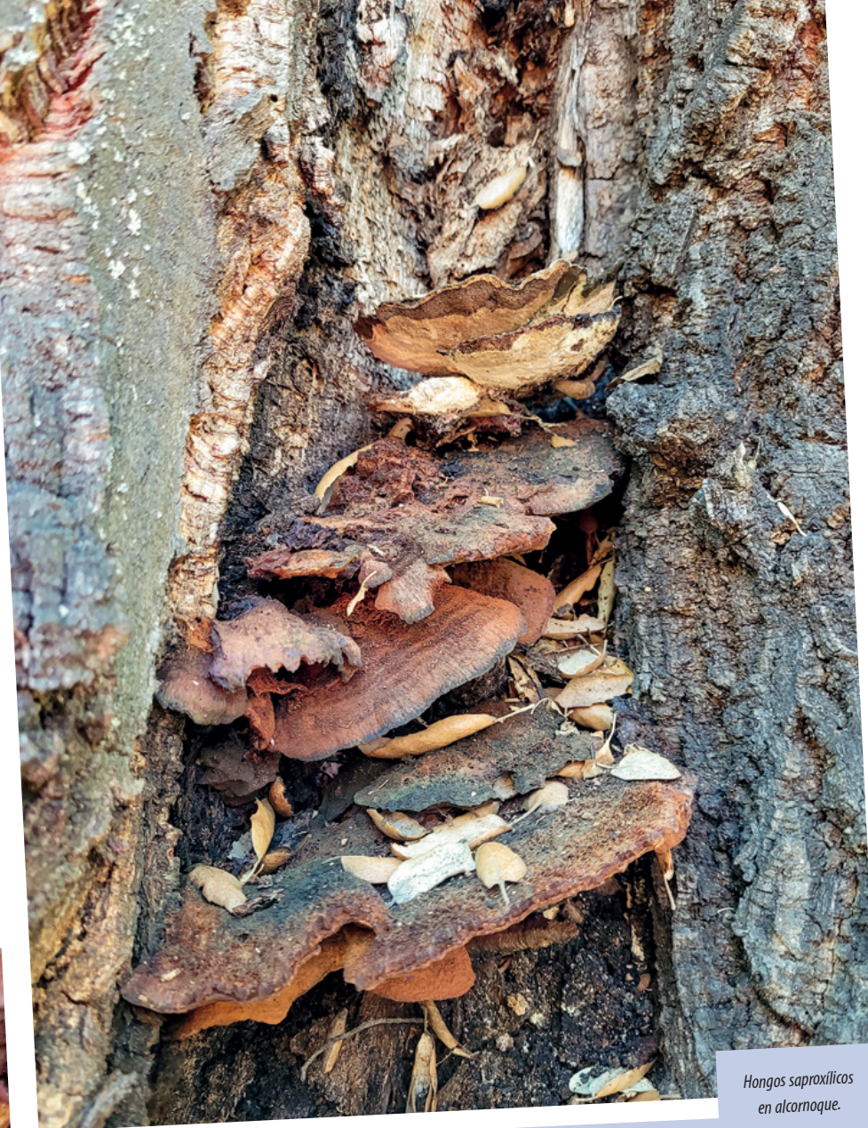
Hongos saproxílicos en alcornoque.

Que un bosque tenga una mayor o una menor diversidad entomológica no es una cuestión baladí, ya que va a condicionar el desempeño de las importantes funciones ecológicas arriba mencionadas. Promover y conservar la biodiversidad y las funciones ecosistémicas es una de las 20 acciones incluidas en la agenda 2030 para el desarrollo sostenible, ya que, en términos generales, la biodiversidad es clave para el mantenimiento de la salud de los ecosistemas y por ende de la del ser humano (FAO, 2018; Valladares et al. , 2022). Paradójicamente, aunque una parte importante de los servicios ecosistémicos que proporcionan los bosques dependen de los insectos, la mayoría de los estudios de biodiversidad en ecosistemas forestales relacionados con el manejo o la gestión se basan en vertebrados y plantas. Sin embargo, tanto la realización de