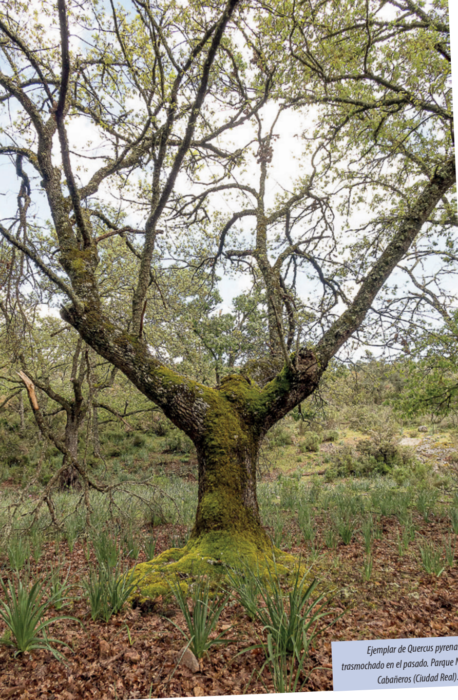
Ejemplar de Quercus pyrenaica trasmochado en el pasado. Parque Nacional de Cabañeros (Ciudad Real).

saproxílica, actúan además como un medio híbrido que permite la coexistencia de organismos propios de áreas forestales y organismos de sistemas abiertos como hábitat mixto de arbolado y pastizal (Galante, 2021). Estos paisajes resultantes de un manejo sostenible del bosque albergan una elevada diversidad de insectos saproxílicos y sirven de refugio a especies especialistas y amenazadas. Desafortunadamente, la presencia de grandes árboles aislados, que tanta importancia tienen en la biodiversidad de insectos saproxílicos, están desapareciendo gradualmente en Europa por un incremento de densidad arbórea o por la intensificación agrícola (Miklín et al. , 2017)