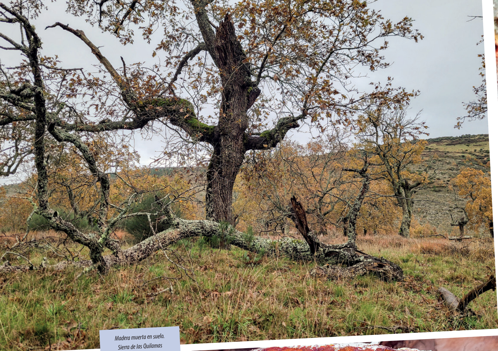
Madera muerta en suelo. Sierra de las Quilamas (La Bastida, Salamanca).

la salud de los ecosistemas y, por lo tanto, la nuestra.