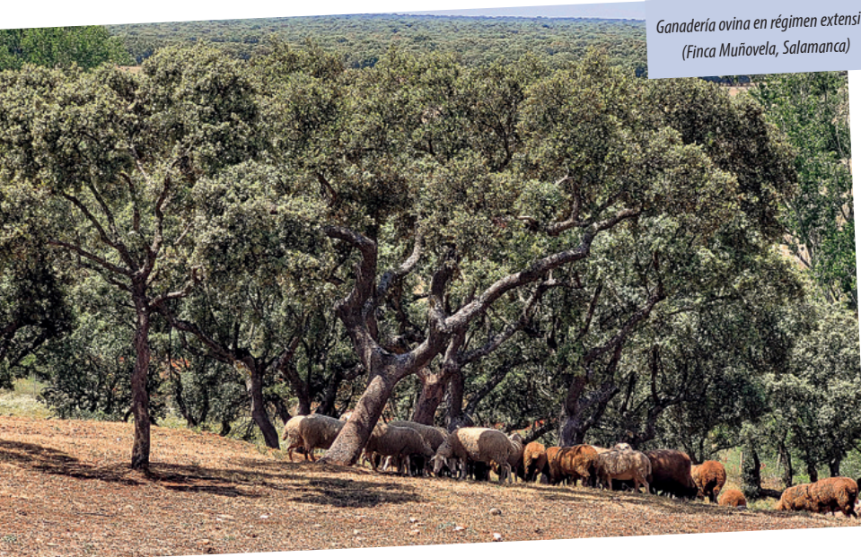
Ganadería ovina en régimen extensivo (Finca Muñozela, Salamanca)

El aclareo o tala selectiva puede tener efectos positivos en la comunidad saproxílica tanto de forma directa como indirecta. La apertura de los bosques supone una mayor entrada de luz solar, que puede tener un efecto positivo en la diversidad de insectos saproxílicos, ya que una mayor insolación favorece tanto a la diversidad y composición de la flora como también al proceso de descomposición de la madera (en presencia de humedad) (Weiss et al. , 2021). Indirectamente, eliminar cierto número de árboles reduce la competencia y permite que los árboles restantes adquieran un mayor tamaño favoreciendo o acelerando la creación de microhábitats (oquedades, etc.). La aparición de oquedades en los árboles comienza en aquellos que superan los 30 cm de diámetro y se incrementa de forma drástica conforme aumenta el diámetro: el número de árboles con oquedades aumenta del 5 al 50 cuando pasamos de árboles con 40-50 cm de diámetro a los que tienen 70-80 cm (Flaquer et al. , 2007; EURPARC, 2020). Las dehesas son un buen ejemplo de esto, atesorando grandes árboles añosos que ofrecen números recursos a la entomofauna