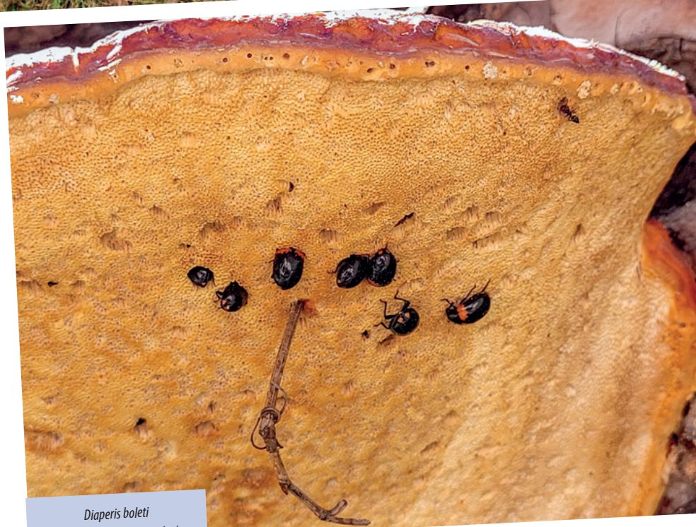
Diaperis boleti (Coleoptera: Tenebrionidae) alimentándose en hongo saproxílico.

Las funciones en las que participan los insectos saproxílicos en los bosques son la descomposición y reciclado de nutrientes (junto con los hongos, escarabajos y termitas son responsables de la descomposición de los mayores volúmenes de madera muerta a nivel planetario), el mantenimiento de la diversidad vegetal a través de la polinización , el control de especies plaga gracias a la depredación y parasitación, y el mantenimiento de la diversidad animal como elemento clave en las redes tróficas. Además, una misma especie de insecto puede participar en más de una de estas funciones ecológicas, ya que las especies con desarrollo holometábolo 1 viven normalmente dos vidas distintas. Desde una perspectiva ecológica, tener una doble vida se traduce en algo muy importante: la multifuncionalidad. Por ejemplo, la especie de coleóptero Cetoniidae , Cetonia aurataformis , es saproxilófaga durante su vida larvaria