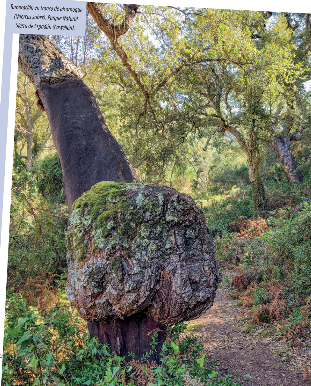
Tumoración en tronco de alcornoque ( Quercus suber ). Parque Natural Sierra de Espadán (Castellón).