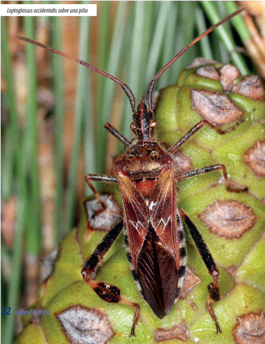
Leptoglossus occidentalis sobre una piña

Originario de la zona occidental de Estados Unidos rápidamente colonizó los países próximos: Canadá y México. Probablemente asociado al tráfico de maderas de coníferas, se ha expandido por otras regiones del mundo. Su presencia en Europa se detectó por primera vez en el año 1999, en el norte de Italia, y diez años después su presencia se había constatado en casi todos los países europeos. Es probable que se hayan producido diversas introducciones, dado la estrecha relación entre los puntos de introducción y los diversos puertos con gran actividad comercial.