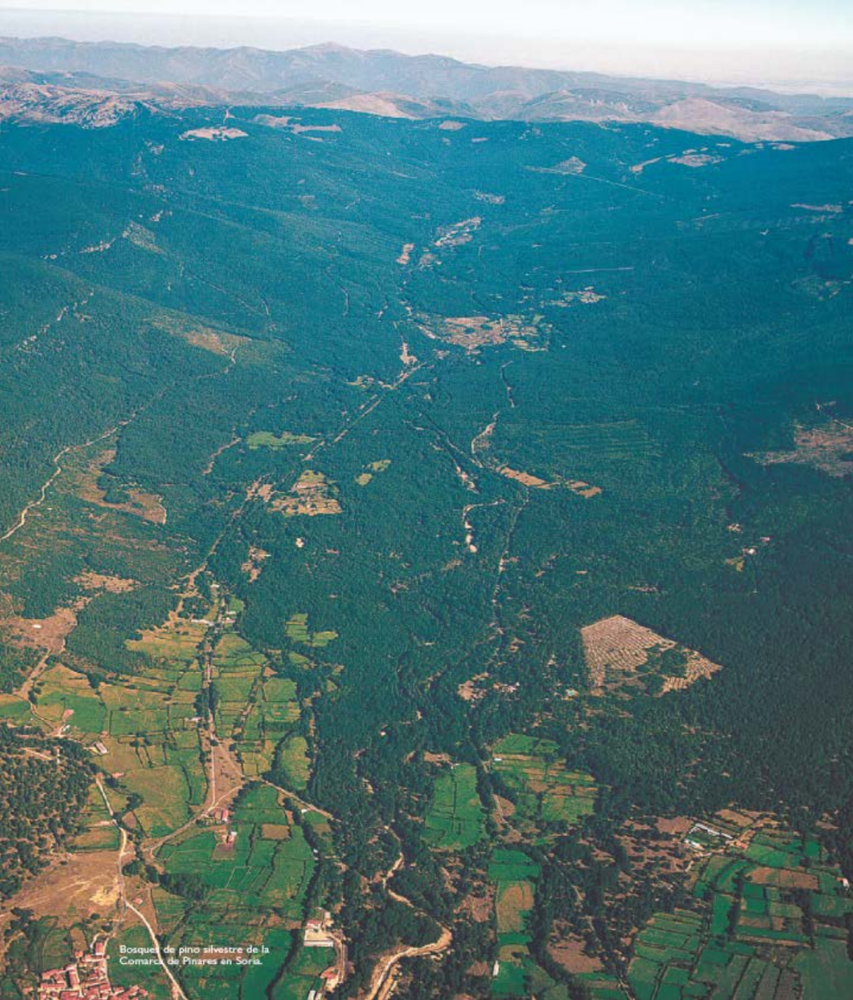
Bosquet de pino silvestre de la Comarca de Pinares en Soría.

Sólo donde la economía local ha conseguido base forestal,